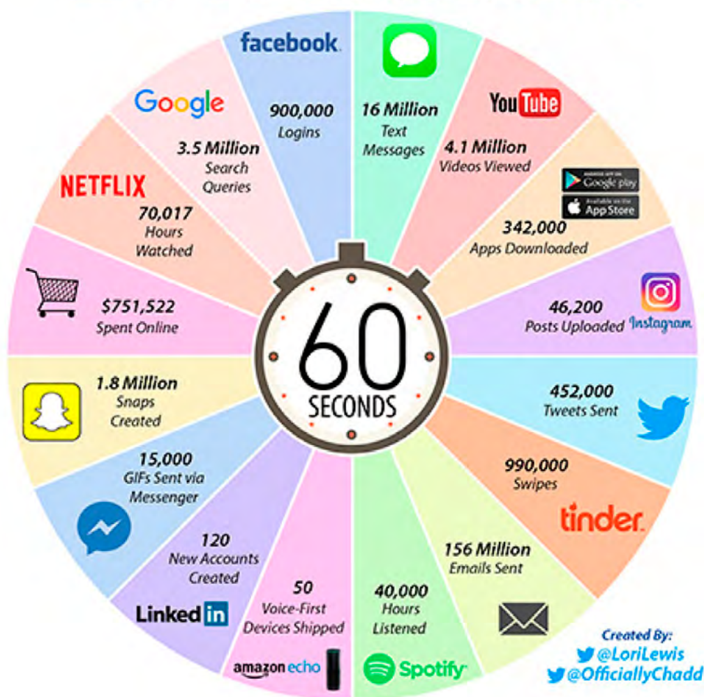
Εικόνα 1: Τι συμβαίνει μέσα σε 60 δευτερόλεπτα στο διαδίκτυο ( http://thebln.com/2017/03/happens-every-minute-internet-2017/ )